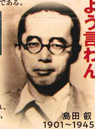
島田 叡 1901~1945

知事着任と同時に、島田は大規模な疎開促進、食料不足解消のため、大量のコメを確保するなど、さまざまな施策を断行。米軍が沖縄本島に上陸した後は、壕(自然洞窟)を移動しながら行政を続けた。だが、戦況の悪化に伴い、大勢の県民が戦闘に巻き込まれ、日々命を落としていく。また、島田自身も理不尽極まりない軍部からの要求と、行政官としての住民第一主義という信念の板挟みになって苦渋の選択を迫られる。戦時下の教育により、捕虜になるよりも自決や玉砕こそが美德とされた時代、島田はしかしそれに反し、周りの人々に何としても「生きろ」と言い続けていた。その考え方はどのように育まれてきたのか？